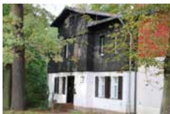
Der Hochsitz auf dem Campus Düppel, Sitz der VetMed-FSI