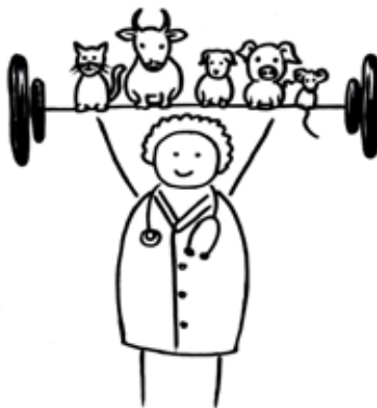
Mental Health Vetmed FU Berlin

PS.: Auch, wenn ihr mal die Uni wechseln solltet, sind mittlerweile an allen Standorten Mental-Health AGs entstanden. Meldet euch einfach bei eurer Fachschaft oder direkt dem bvvd und erkundigt euch, wir helfen gerne weiter!