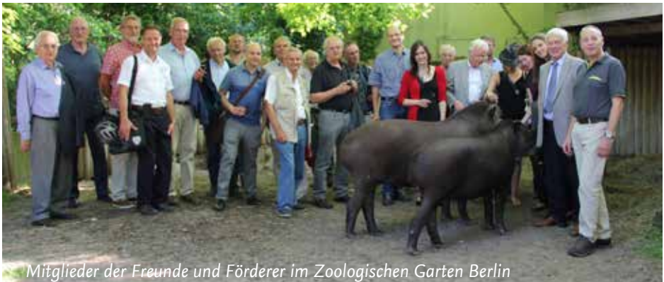
Mitglieder der Freunde und Förderer im Zoologischen Garten Berlin