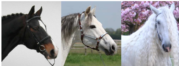
VDL Pessoa (Animo x Zancara)